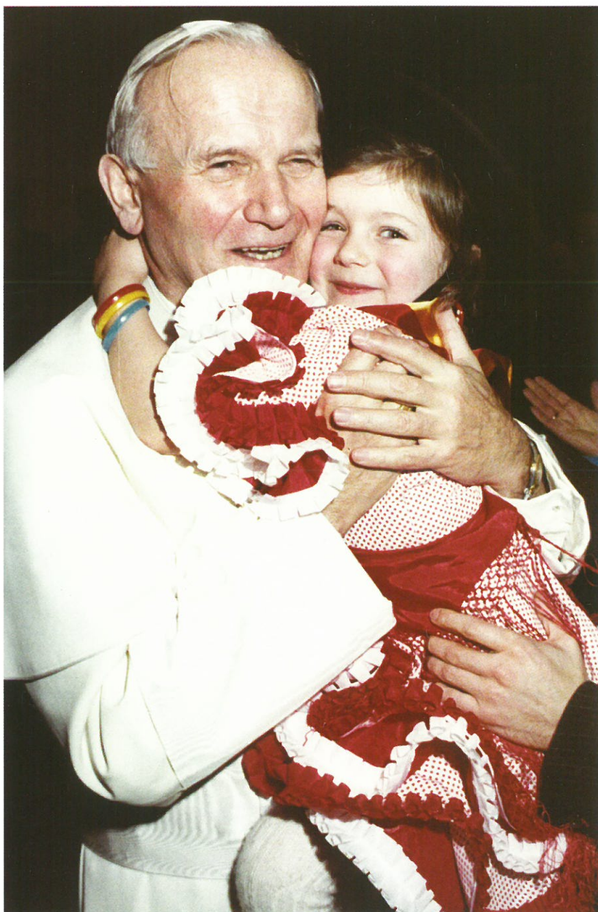
„Biskup Rzymu modli się za wszystkich Młodych na całym świecie, za każdą i za każdego”. Te słowa Jan Paweł II zawarł w Liście do młodych w siódmym roku swego pontyfikatu

Jan Paweł II już w dniu inauguracji swego pontyfikatu wskazał, jaką grupę wiekową ludzi na całym świecie otoczy szczególną miłością i opieką oraz komu poświęci dużo uwagi. Przez cały okres sprawowania swej posługi podkreślał, że młodość kształtuje drogę życiową na wiele lat. Jan Paweł II przewodniczył pierwszym dziewięciu edycjom. Zmarł cztery miesiące przed dziesiątym spotkaniem. O tym, jak ważną rolę odgrywa misja zapoczątkowana przez Jana Pawła II, świadczy fakt, że kardynałowie na spotkaniach poprzedzających konklawe po śmierci papieża Polaka ustalili, że jego następca w pierwszej kolejności zobowiązany jest doprowadzić do jak najszybszego otwarcia procesu beatyfikacyjnego swego poprzednika oraz przewodniczyć Światowym Dniom Młodzieży w Kolonii. Cele te zrealizował Benedykt XVI, a obecnie z młodzieżą z całego świata spotyka się papież Franciszek.