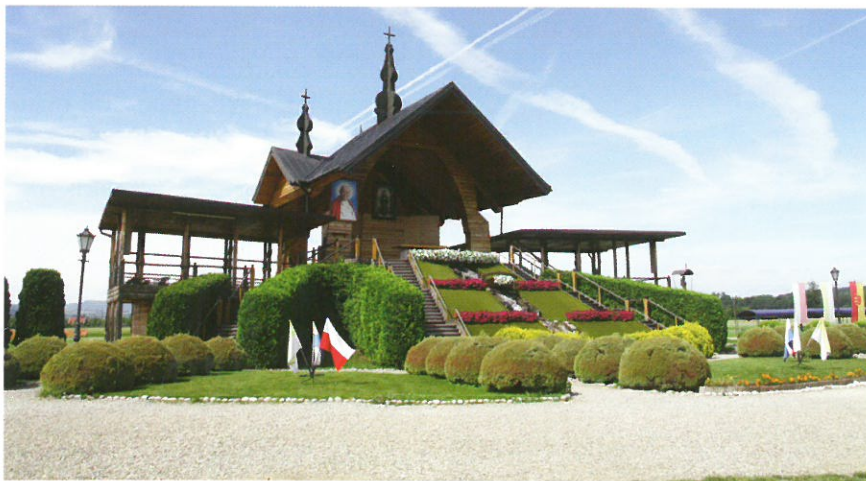
Wizytę Ojca Świętego w Starym Sączu i uroczystość kanonizacji św. Kingi upamiętnia ołtarz polowy

Była to praktycznie jednodniowa wizyta apostolska, stanowiąca część pielgrzymki Jana Pawła II do Czech. Papież przybył oddać cześć św. Janowi Sarkandrowi, którego kanonizował dzień wcześniej w Ołomuńcu. Odwiedził również 3 miasta: Skoczów, Bielsko-Białą i Żywiec oraz wygłosił 4 przemówienia.