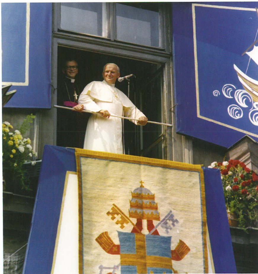
Wieczorem 6 czerwca 1979 r. w Krakowie Jan Paweł II, wywołany śpiewami młodzieży, zapoczątkował swe wystąpienia w oknie Kurii Metropolitalnej w Krakowie przy ulicy Franciszkańskiej 3. Tradycję tę podtrzymał również papież Benedykt XVI

Pielgrzymka ta odbyła się pod hasłem „Gaude Mater Polonia”, a jej głównym celem był udział Jana Pawła II w obchodach 900. rocznicy śmierci św. Stanisława Biskupa Męczennika. Papież odwiedził 8 miast: Warszawę, Gniezno, Częstochowę, Kraków, Kalwarię Zebrzydowską, Wadowice, Oświęcim i Nowy Targ oraz wygłosił 46 homilii i przemówień. 2 czerwca 1979 r. na placu Zwycięstwa w Warszawie Jan Paweł II wygłosił słynne słowa: „Wołam, ja, syn polskiej ziemi, a zarazem ja, Jan Paweł II, papież. Wołam z całej głębi tego Tysiąclecia, wołam w przeddzień Święta Zesłania, wołam wraz z wami wszystkimi: Niech zstąpi Duch Twój! Niech zstąpi Duch Twój! I odnowi oblicze Ziemi!... Tej Ziemi!”.