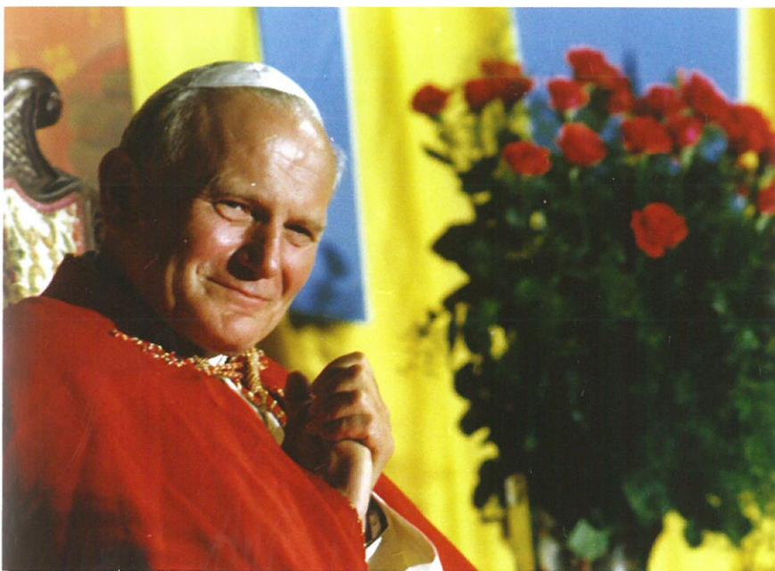
Wizyty w ojczyźnie napawały Jana Pawła II radością, zresztą, w tych dniach szczęśliwi byli wszyscy Polacy

Długa, piękna i bardzo sentymentalna wizyta Jana Pawła II, który przybył z hasłem „Bóg jest miłością”. Głównymi celami pielgrzymki były: zakończenie II Ogólnopolskiego Synodu Plenarnego, kanonizacja bł. Kingi oraz beatyfikacja 108 męczenników z okresu II wojny światowej, księdza Stefana Frelichowskiego, matki Reginy Protman i Edmunda Bojanowskiego. Papież odwiedził 20 miast: Gdańsk, Pelplin, Elbląg, Licheń, Bydgoszcz, Toruń, Elk, Wigry, Siedlce, Drohiczyn, Warszawę, Sandomierz, Zamość, Radzymin, Łowicz, Sosnowiec, Kraków, Stary Sącz, Wadowice i Gliwice. W spotkaniach z Janem Pawłem II uczestniczyło ponad 10 milionów Polaków.